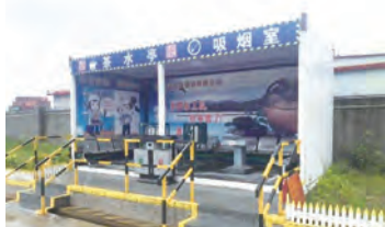
定型化吸烟、茶水亭