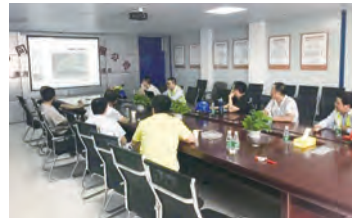
安全月观摩现场讲评会

通过此次典型项目的观摩,使大家对各自所在项目的安全管理工作和创优工作拓宽了思路。同时通过相互讨论交流,提高了管理技巧,增加部门人员之间凝聚力。此次观摩活动进一步加强施工安全生产宣传教育,确保安全生产红线意识和责任意识落地生根。