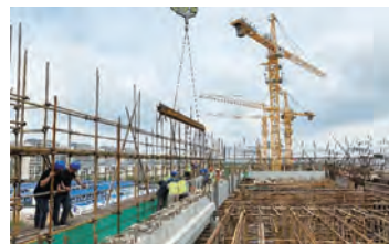
大体积重型预制砼构件吊装现场作业

该项目为预制装配式结构商办楼,现处于结构施工阶段,各号楼单体预制装配率均在42%,单根构件重量大。公司技术中心BIM团队事先对行车路线、材料堆场布置、吊装等工作进行模拟,通过BIM技术有效进行现场安全管理。另外,项目部编制的模板支架方案并通过了专家进行论证,确保了支撑体系的安全。