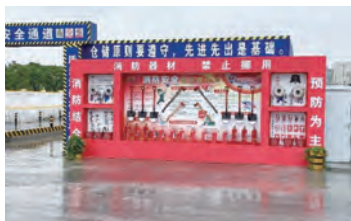
定型化消防工具柜

该项目现处于地下结构施工阶段,利用宽敞的场地优势,通过事先策划,在场内东侧设置了双道围墙,内道围墙内为施工区域,内外道围墙之间布置成了展示区域,包括VR安全事故体验区、安全帽撞击体验区、综合用电安全体验区、定型化工具展示区等。施工场内沿场地围墙设置防尘喷淋系统、消防栓、施工用水回收等措施。